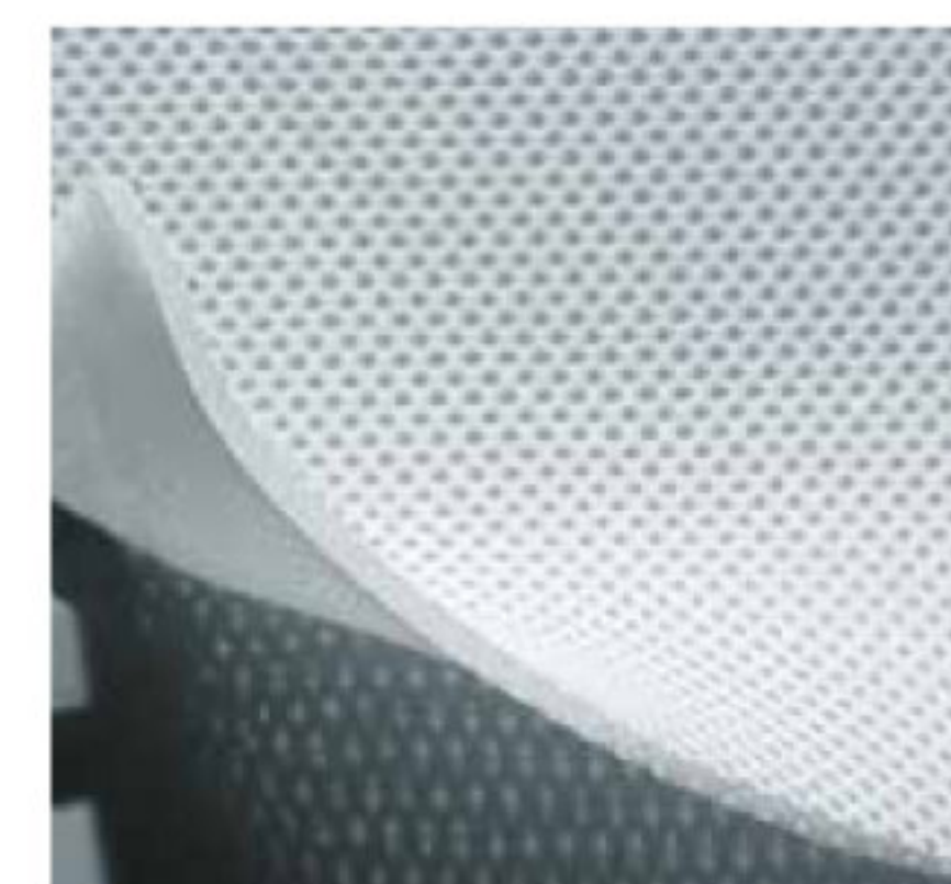
PARTICOLARE DEL PANNELLO VOLUMETRICO AIR MESH 3D® TRIDIMENSIONALE