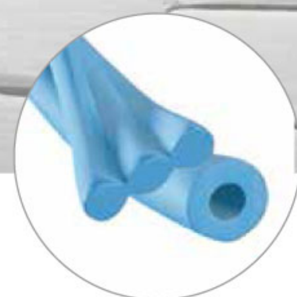
Struttura del filato impiegato nel tessuto Thermo Control Klima Fresh