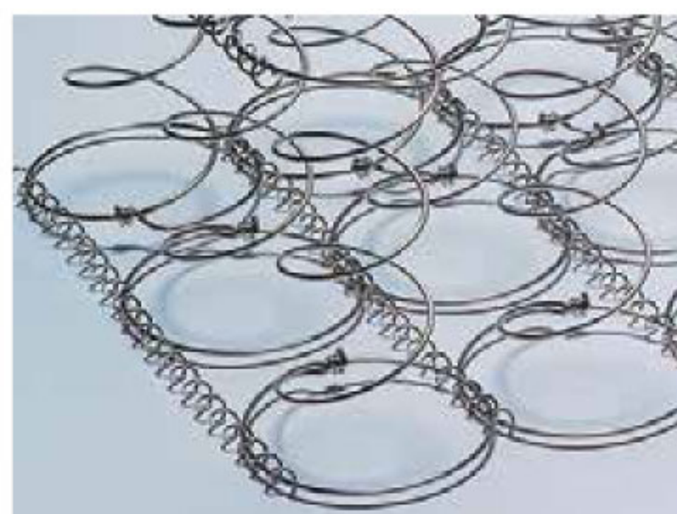
MOLLEGGIO BONNEL CON 400 MOLLE NELLA VERSIONE MATRIMONIALE