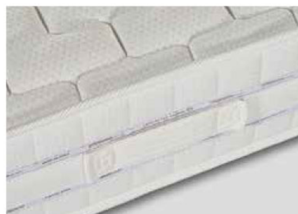
PARTICOLARE MANIGLIA RINFORZATA E AREATORE CONTINUO IN AIR-MESH 3D

NELL'ORDINE SPECIFICARE CODICE E MODELLO FODERA: Fisso standard Cod 62 - Fodera Green First Cod 54