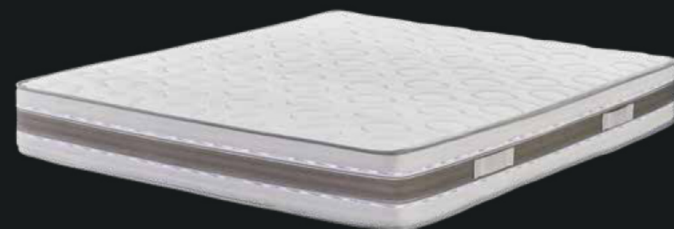
PANNELLO ESTIVO POSTO SOTTO IL TOPPER INVERNALE ASPORTABILE

F lexilan inserisce nella propria gamma un prodotto, altamente innovativo, il quale rende ottimali comfort ed ergonomicità sul solo lato superiore, sfruttando la sovrapposizione e le diverse caratteristiche di tre strati di schiumati tecnici: base in Air-Cell, lastra centrale in memoria di forma HD e lastra superiore in memory Breeze.