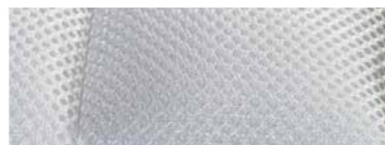
PARTICOLARE PANNELLO TRASPIRANTE IN AIR-MESH 3D