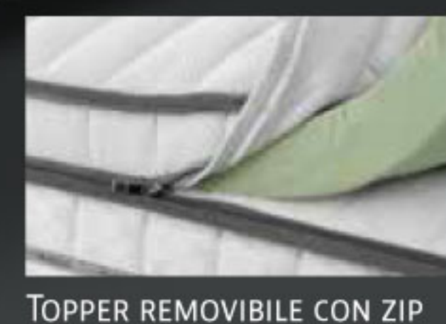
TOPPER REMOVIBILE CON ZIP