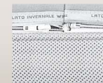
Cerniera su 4 lati