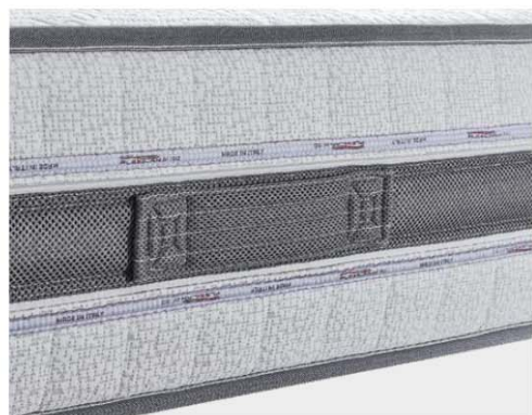
FASCIA CON AERATORE CONTINUO, FAVORISCE IL RICIRCOLO DELL'ARIA PER DISSIPARE L'UMIDITÀ.

Flexilan In questa Cover utilizza fibre tecniche all'avanguardia e fibre di origine naturale , abbinandole in modo da dare il giusto tepore dal lato invernale, donare freschezza sul lato estivo e dissipare l'umidità corporea a garanzia di un microclima ideale .