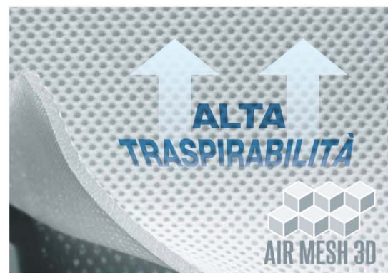
PARTICOLARE DEL PANNELLO IN TESSUTO VOLUMETRICO AIR MESH 3D® A STRUTTURA TRIDIMENSIONALE