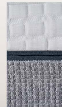
Tessuti con trattamento Sanitized