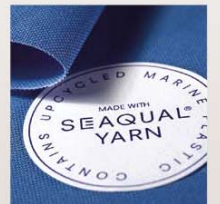
Tessuto Seaqual Yarn

LA COVER CHE RISPETTA L'AMBIENTE REALIZZATA CON FILATO SEAQUAL®