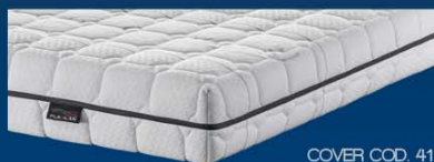
COVER COD. 41

Anallergica, con ioni d'argento MATERASSO FINITO H. 19