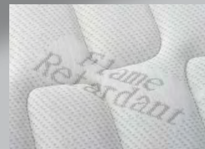
PARTICOLARE DEL TESSUTO DI RIVESTIMENTO DEI PANNELLI CON LOSANGATURA A TUTTO CAMPO